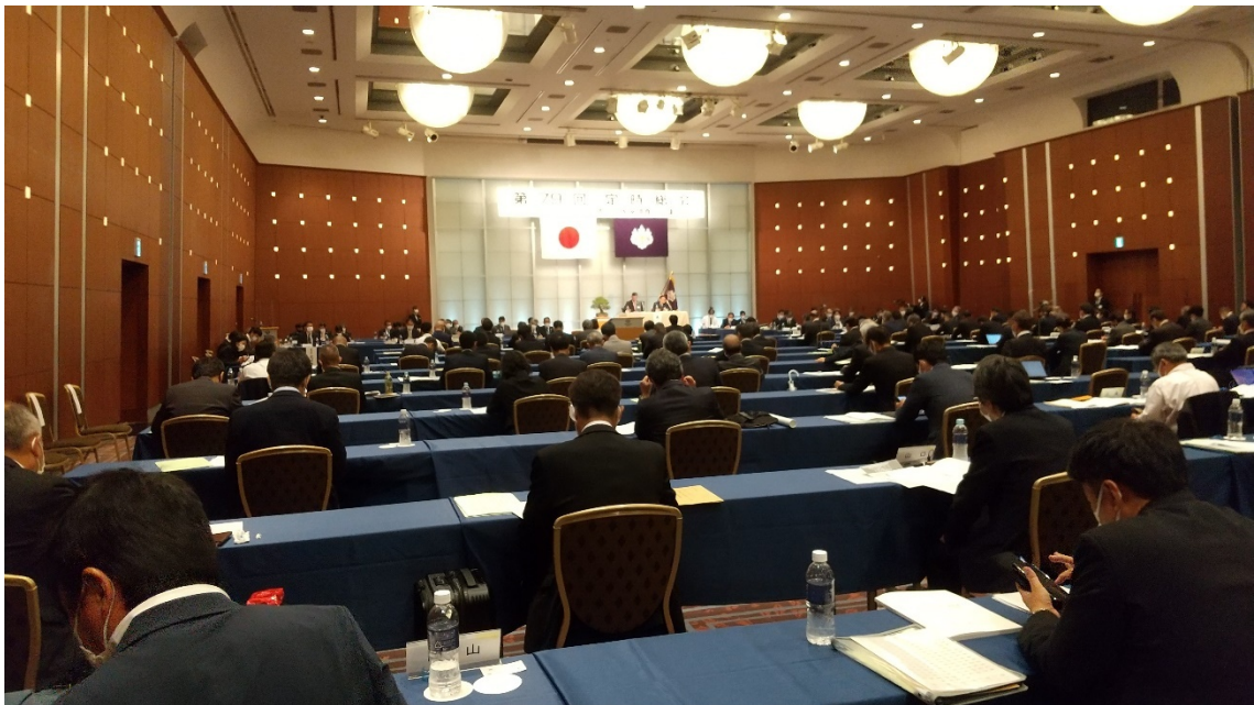
定時総会「東京ドームホテル」会場

今回の定時総会では懇親会はおこなわれず、総会のみで開催でしたが、会場ロビーで他県の方と歓談し、その話の中で他会の思いや悩みをお聞きしました。福岡会にない思いや悩みを聞き、改めて私達福岡会を見つめなおすことができました。