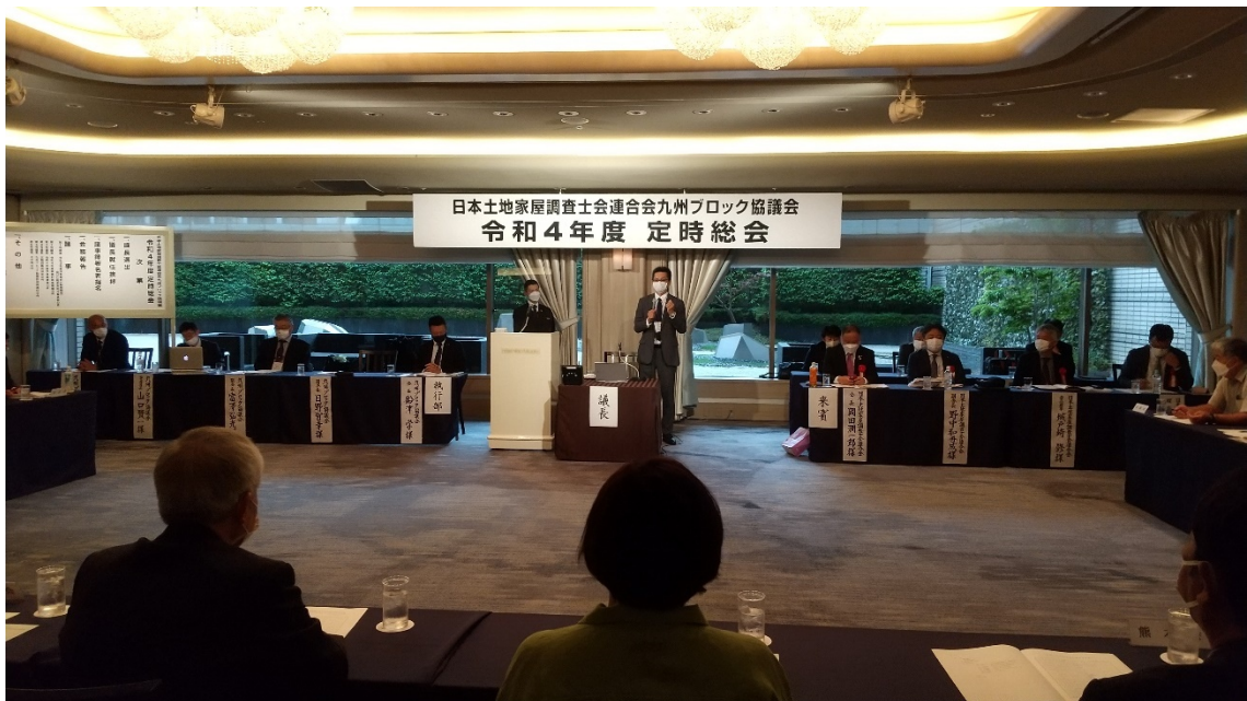
定時総会会場 議長は日野会長

総会へは来賓7名、執行部5名、代議員21名、オブザーバー7名の計40人が参加し議事が進行しました。